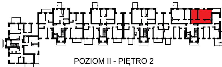
POZIOM II - PIĘTRO 2