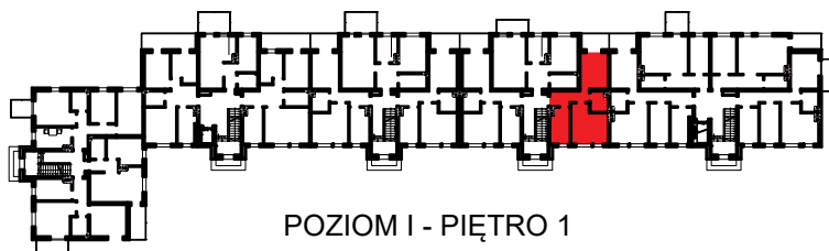
POZIOM I - PIĘTRO 1