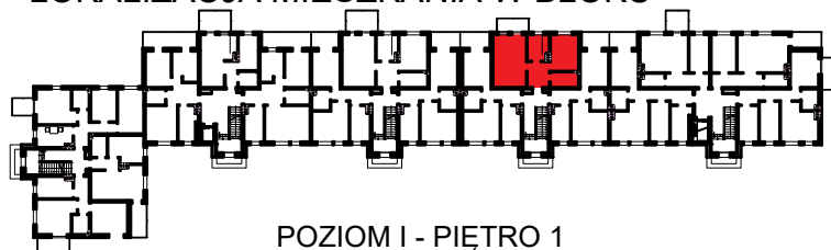
POZIOM I - PIĘTRO 1