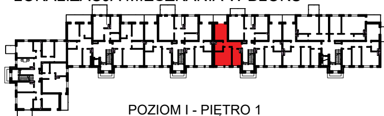
POZIOM I - PIĘTRO 1