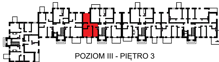
POZIOM III - PIĘTRO 3