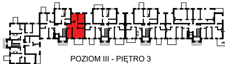
POZIOM III - PIĘTRO 3