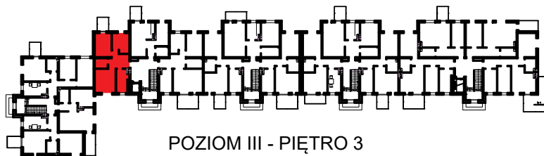
POZIOM III - PIĘTRO 3