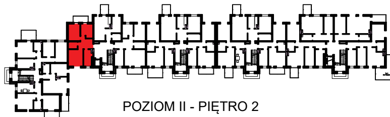
POZIOM II - PIĘTRO 2