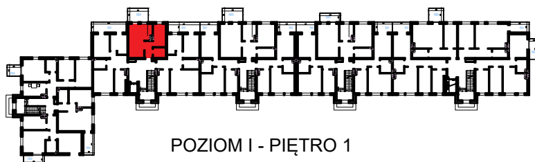
POZIOM I - PIĘTRO 1